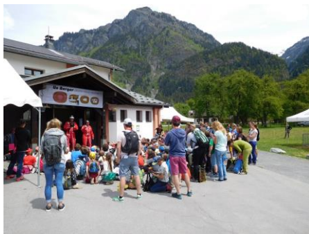
La dernière journée de mutualisation en 2019 à Servoz